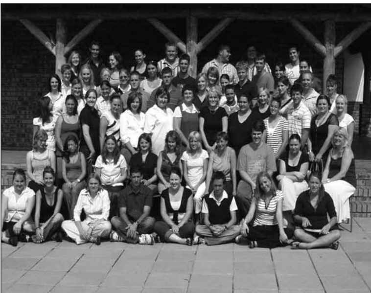
Al die eerste- tot vierdejaarstudente wat in 2007 by Aros gestudeer het.